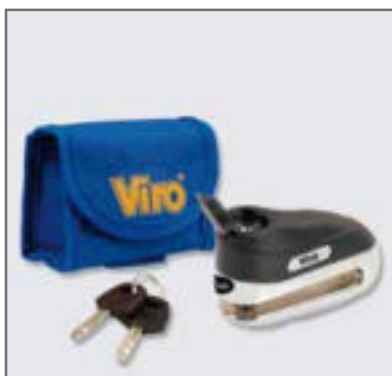
Serratura protetta contro l'aggressione degli agenti atmosferici