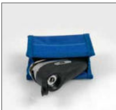
Forniti di comoda custodia in tela di nylon